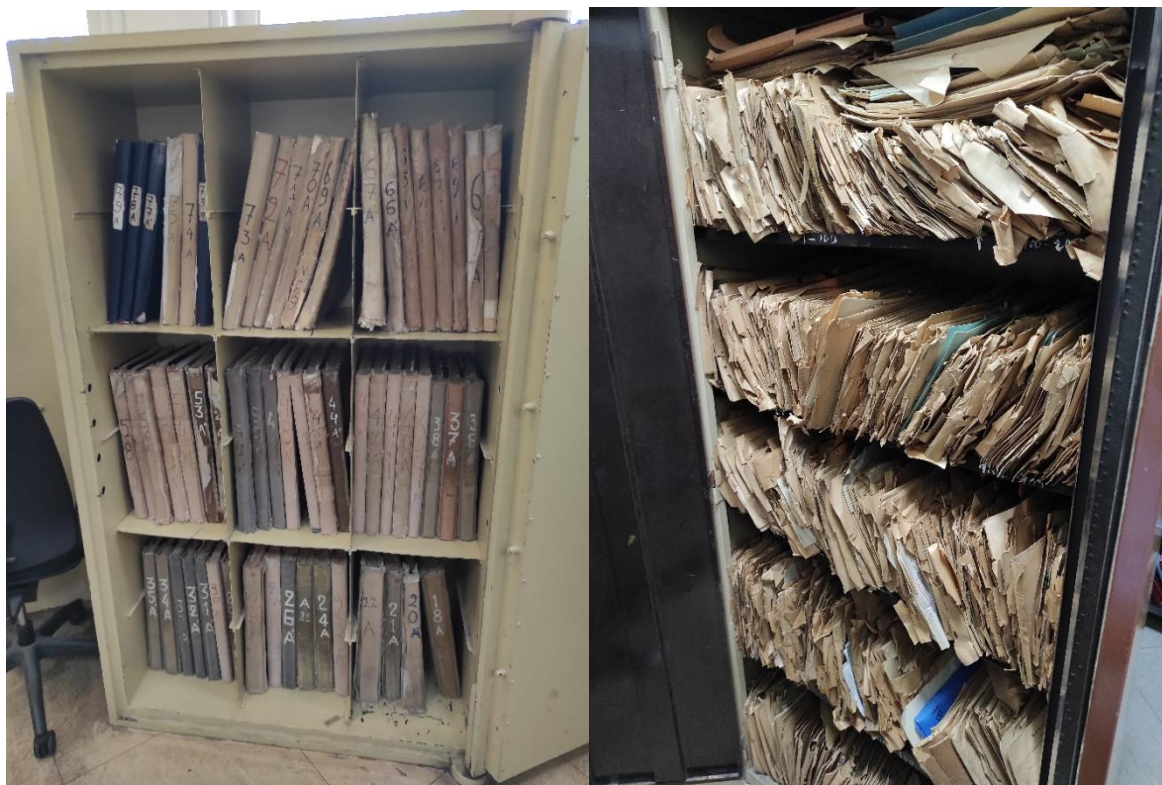
Εικόνες από αποθηκευμένο αρχείο νηολογίων και φακέλων

Συνήθως χρησιμοποιούνται οι μερίδες προς ευκολία της λιμενικής αρχής και ο όγκος και των μερίδων και των φακέλων εξαρτάται και από το μέγεθος του εκάστοτε πλοίου. Οι καταχωρήσεις του συγκεκριμένου αρχείου είναι όλες έγχαρτες και χρονολογικά τοποθετημένες και έχει βασική συσχέτιση με ΔΠΝ και ΔΙΝΕΘΑΤ.